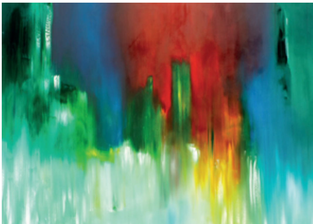
New York, I Love You 182X122, 2014

Pour sa deuxième exposition personnelle en France, « The Fifth Element », l'artiste américaine Laurel Holloman nous invite à un voyage spirituel et à une rencontre avec la Terre, l'Eau, le Feu, l'Air et le mythique Cinquième Elément.